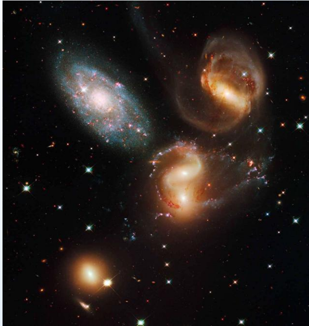
7319, 7318A, 7318B et 7317 se situent à 300 millions d'années-lumière, NGC 7320 (la plus en haut à gauche de l'image) n'est qu'à 50 millions d'années-lumière.