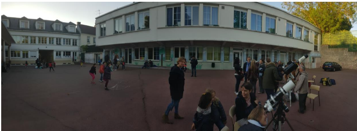
Photo prise en fin d'observation